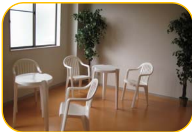
談話室でチョット休んで いきませんか！