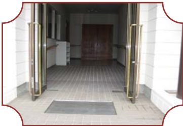
スロープのついた 広くて明るい玄関