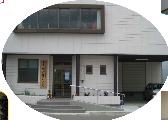
ようやく完成した「まちなかまごころ」です