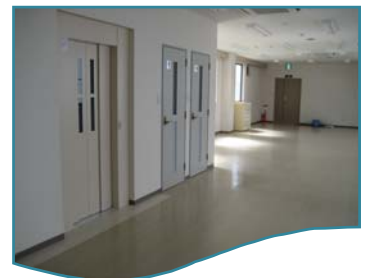
エレベーターも設置 され2階への移動も楽々