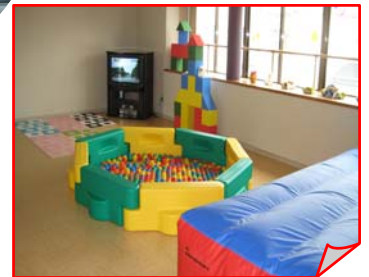
ころころルーム 元気な声が…